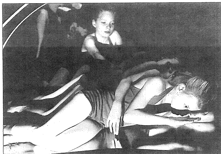
Der er tid til snak og leg, men også koncentration under prøverne.