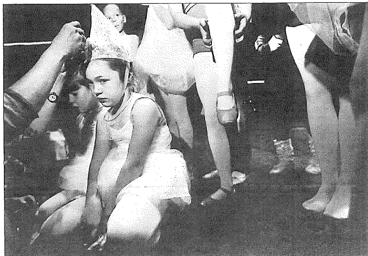
Balletbørnene spiller forskellige roller som vanddråber, blomster og græsstrå. Stykket handler om naturens cyklus.